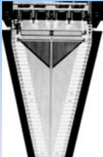
OPAL Reunion Plenary