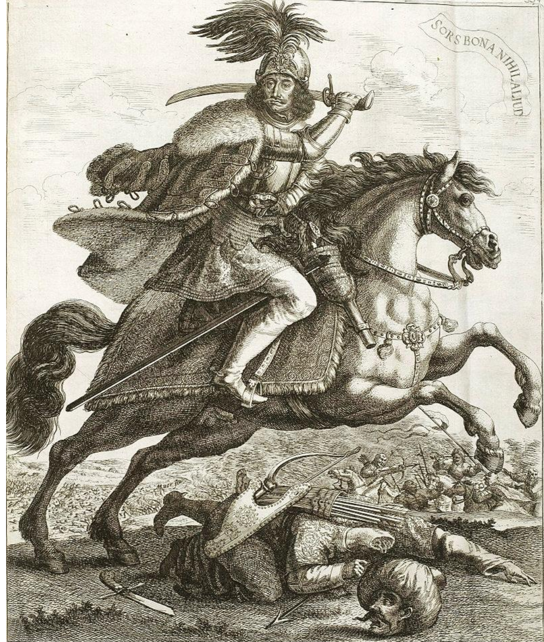
NICOLAUS COMES SERINI DUX EXERCITUS HUNGARICI CONTRA TURCOS GENERALISSIMUS, ETC.

SERINVS pugnans Christi est quod cæsus in hostes, Aeterno cunctos nomine it ante duces.