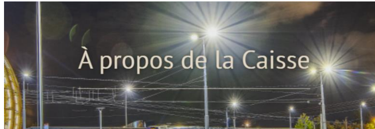
Fondé en 1955, le Fonds est responsable de la prévoyance en matière de retraite pour environ 3 700 membres et environ 3 600 bénéficiaires dans 48 pays du monde.

Notre site internet a des informations générales sur la Caisse