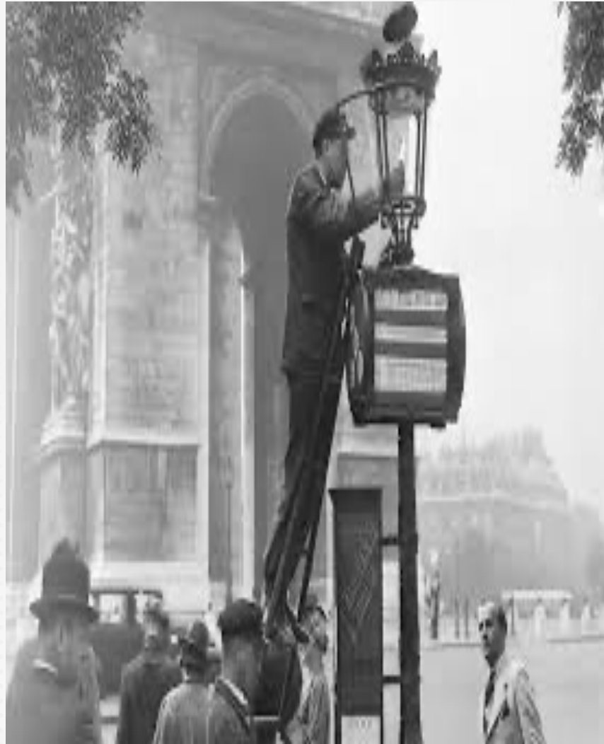
Eclairage en réverbères