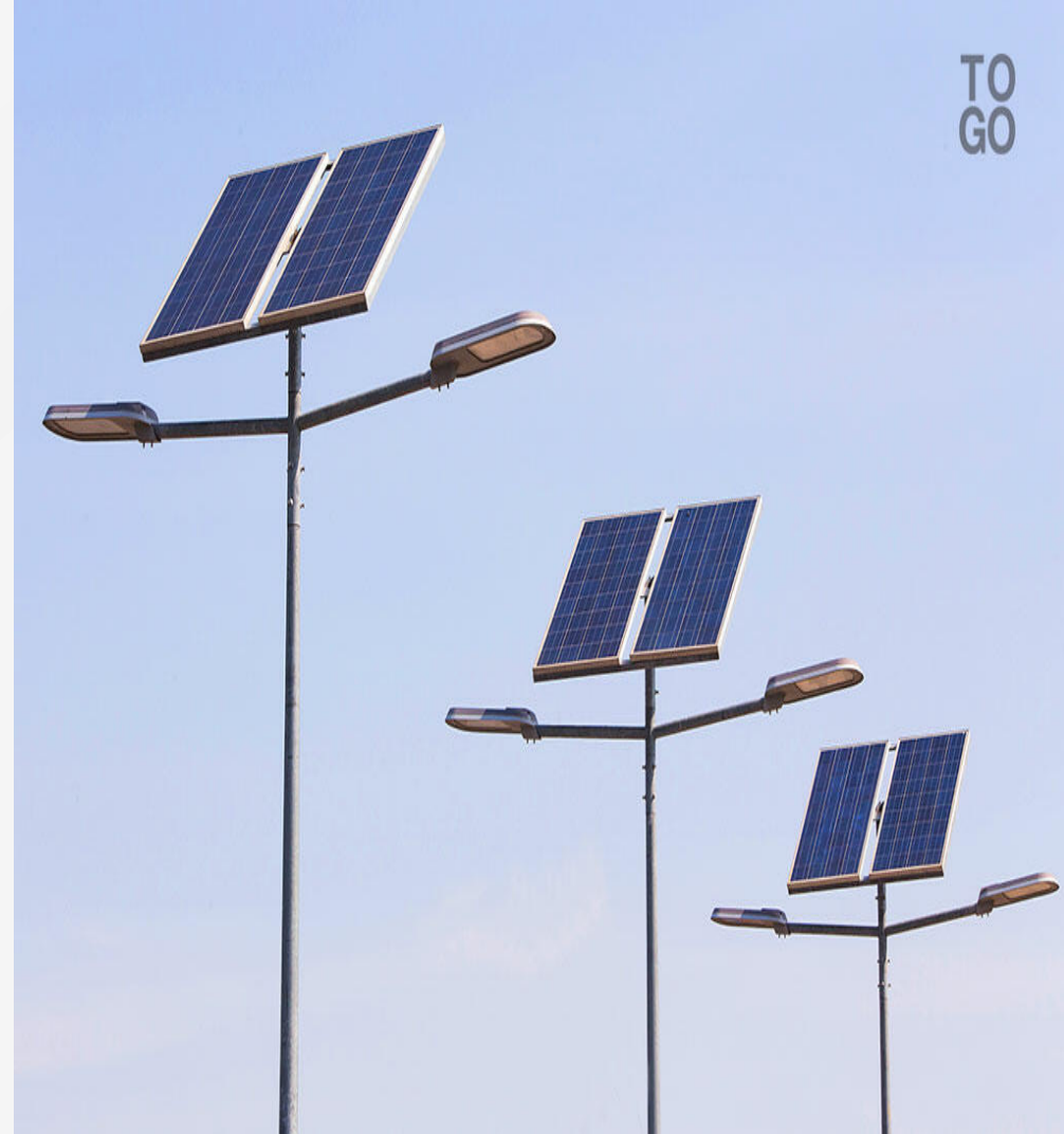
Eclairage autonome en énergie renouvelable