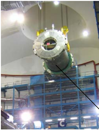
La descente du calorimètre central