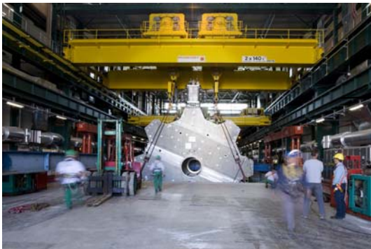
La descente de l'un des toroïdes d'extrémités