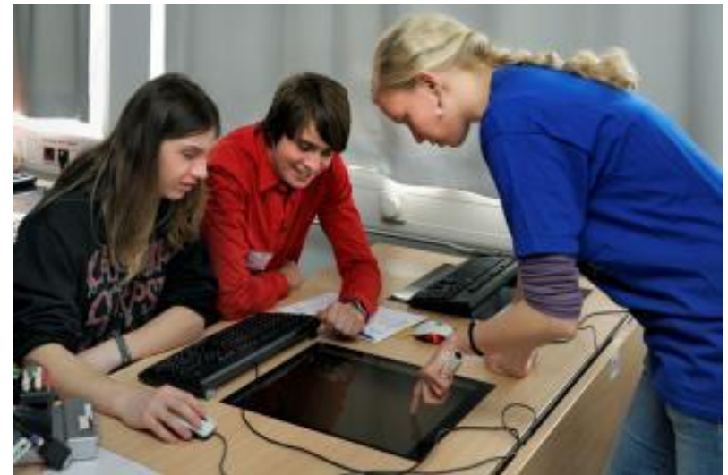
Wie ist Deine derzeitige Ausbildungssituation?