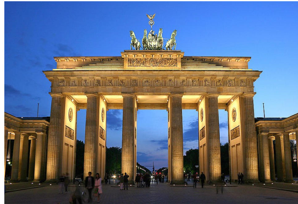
Humboldt-Universität zu Berlin