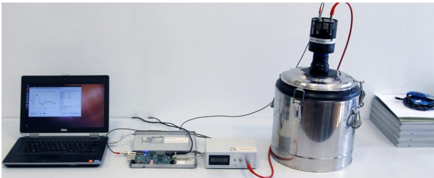
LIDO bei DESY