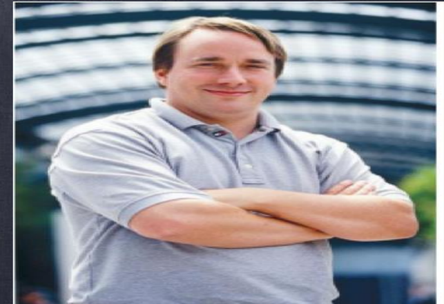
Linus Benedict Torvalds